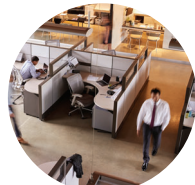
모바일 사원증 및 방문객 출입증